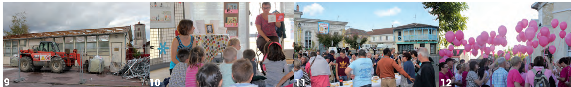
Fabrique : première étape, la salle de musculation disparaît - (10) Exposition Manceau au centre culturel La Fabrique - (11) Fête des associations et des nouveaux arrivants - (12) Octobre rose, journée d'action à Saint-Astier