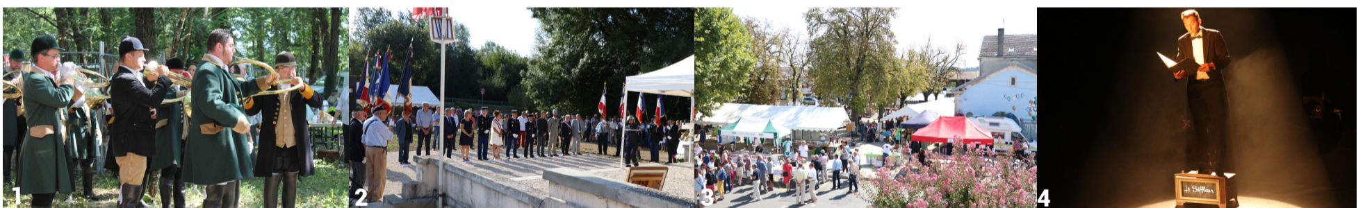
(1) Fête de la chasse