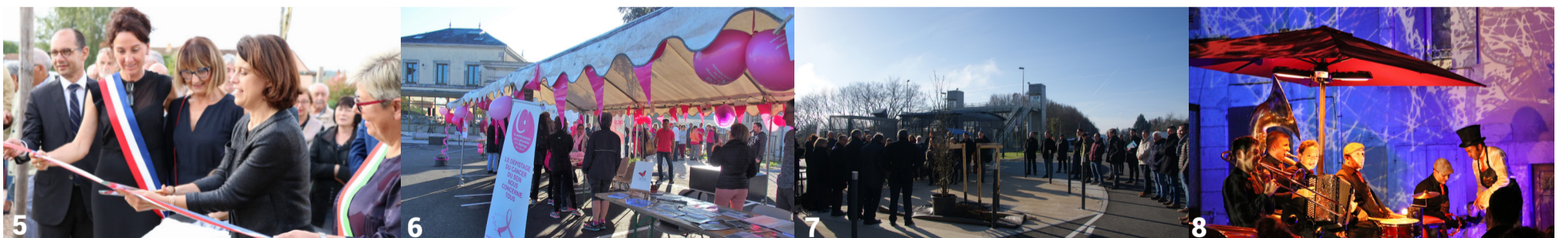
(5) Inauguration du square Annone Veneto