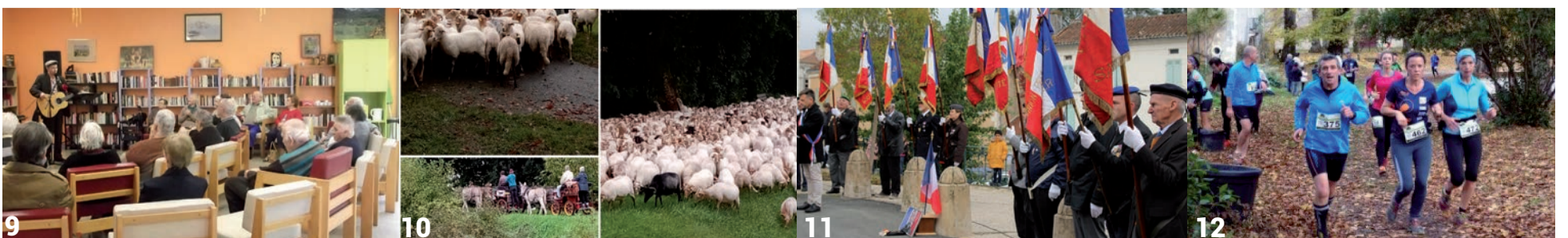
(9) Après-midi musical à la Résidence Autonomie