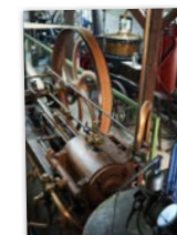
Musée André Voulgre - Kristof Guez

Rencontres pour offrir aux enfants une vue d'ensemble sur l'histoire locale et l'évolution de la photographie. Patrimoniale au Pays d'Astérius Atelier Kristof Guez / Musée André Voulgre & L'industrielle "Mucidan": Classes élémentaires - Janvier, Février et Avril 2025