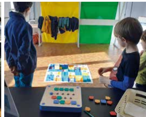
Animation Cubetto - Médiathèque Municipale