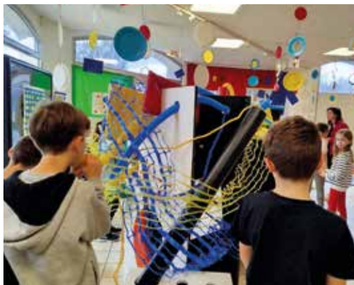
Exposition Hervé TULLET - La Fabrique