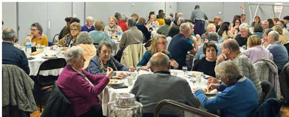
Ciné Resto - Cinéma La Fabrique